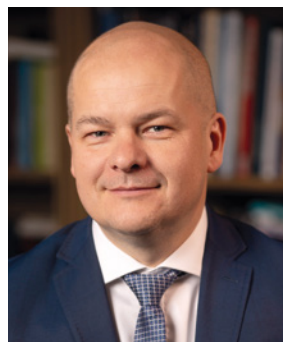
ANDRZEJ NOWAKOWSKI Prezydent Miasta Płocka