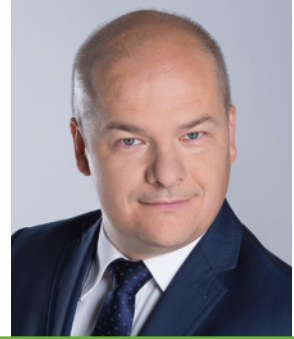
ANDRZEJ NOWAKOWSKI Prezydent Miasta Płocka