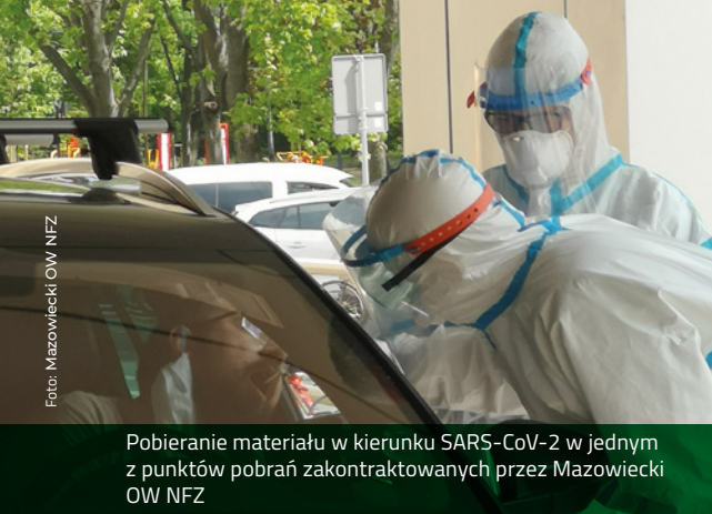
Pobieranie materiału w kierunku SARS-CoV-2 w jednym z punktów pobrań zakontraktowanych przez Mazowiecki OW NFZ

świadczeń wynikającej z rachunku za dany okres sprawozdawczy. Za lipiec świadczeniodawcy z ziemi płockiej otrzymali dodatkowo ponad 600 tysięcy złotych. W Zarządzeniu Nr 104/2020/DSOZ Prezesa NFZ z dnia 8 lipca 2020 roku można znaleźć szczegółowe informacje, których rodzajów świadczeń dotyczy powyższa opłata.